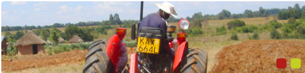
Een trekker voor de Stichting Christelijke Hulp in Kenia